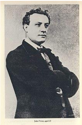
Portrait de Jules Verne à 25 ans

« J'étais au plus haut point sous l'influence de Victor Hugo, très passionné par la lecture et la relecture de ses œuvres. À l'époque, je pouvais réciter par cœur des pages entières de Notre-Dame de Paris, mais c'étaient ses pièces de théâtre qui m'ont le plus influencé, et c'est sous cette influence qu'à l'âge de dix-sept ans, j'ai écrit un certain nombre de tragédies et de comédies, sans compter les romans ». 1